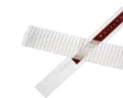
カットペーパー(パネル板付) (20枚入) 単品 ¥660