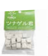
ツナゲル君 (20個入) 単品 ¥990