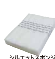
シルエットスポンジ (お徳用) (50枚入) 単品 ¥3,080