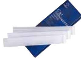
シルエットスポンジ (20枚入) 単品 ¥1,320