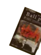
ボールピン (6本入) 単品 ¥550