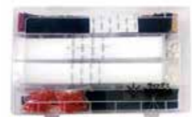
ウィッグでポリカ 単品 ¥9,020