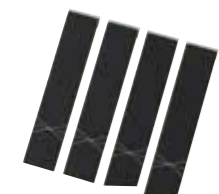
黒パネル(4枚セット) 単品 ¥660