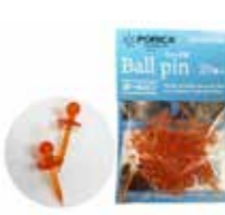
ウィッグ用ボールピン (20本入) 単品 ¥1,320