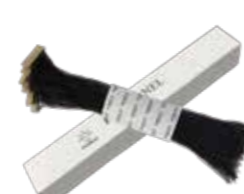
ニットパネル(20枚) 単品 ¥2,200