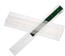
ワインディングペーパー (10枚入) 単品 ¥440