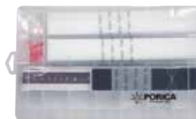
ツールセット 単品 ¥4,950