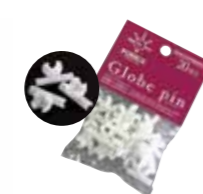
グローブピン (20本入) 単品 ¥1,320