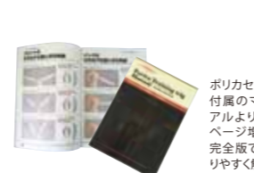
ポリカセットに付属のマニュアルよりも26ページ増量の完全版でわかりやすく解説。 ポリカ練習マニュアル (完全版) 単品 ¥2,750