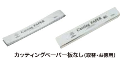
カットペーパー(パネル板なし)(取替・お徳用) (100枚入) ¥880 (200枚入) ¥1,650 パネル板なしのカットペーパー(お徳用)です。セットまたは単品カットペーパーのペーパー部分を使い切ったら、ペーパー部分を替えてご使用いただけます。